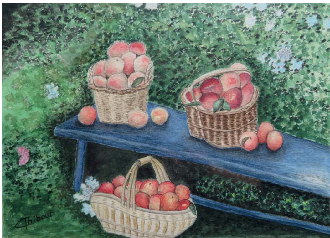
Claudine Thibout-Pivert Le vieux banc